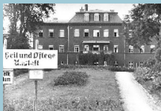
Heil- und Pflegeanstalt Kaufbeuren (Juli 1945)

Erinnerungsblatt 57 (2022) zusammengestellt durch die Stolpersteininitiative Augsburg