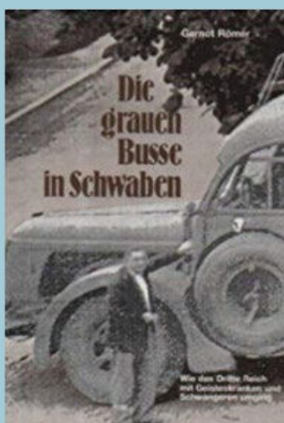
Deportation mit den „grauen Busen“

Jeder ankommende Transport wird ohne Rücksicht auf die Tageszeit sofort untersucht und die zur Euthanasie bestimmten Menschen sofort vergast. Die Kranken werden in ein Aufnahmezimmer geführt. Die Transportleiter Schwenninger und Seibl übergeben die Krankengeschichten dem Büropersonal. An Hand dieser Unterlagen wird die Prüfung der einzelnen Personalien vorgenommen. Danach gelangen die Kranken in einen anderen Raum, wo sie zur Entkleidung kommen. Schließlich führt man die Patienten den Ärzten zur letzten Untersuchung vor. In manchen Fällen werden Beruhigungsspritzen