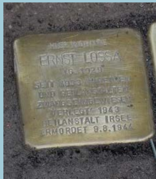
Am 4.5.2017 wurde in der Wertachstrasse 1 ein Stolperstein verlegt.

2007 benannte die Stadt Augsburg in Pfersee auf dem Gebiet der ehemaligen Sheridankaserne nach Ernst Lossa (Foto 2011)