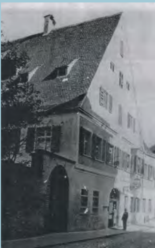
Vorderansicht Kapuzinergasse 24