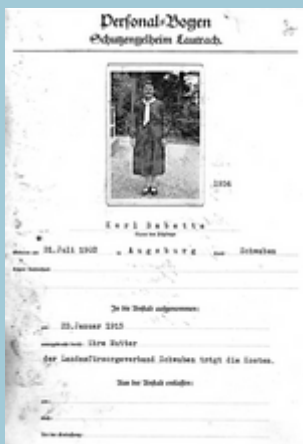
Personalbogen Schutzengelheim Lautrach

Erinnerungsblatt 29 (2020) zusammengestellt durch die Stolpersteininitiative Augsburg