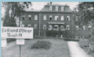
Heil- und Pflegeanstalt Kaufbeuren 1945

16.1.40: Beteiligt sich gelegentlich an Neckereien, jedoch immer nur als Verführter, nie als Urheber. Geht sonst Streitigkeiten aus dem Weg,