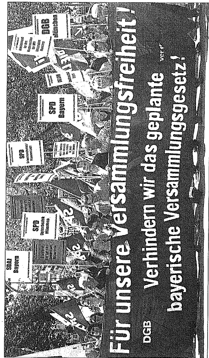
Demo gegen das neue bayerische Demo-Gesetz: Gewerkschaften und Vereine befürchten Behinderungen ihrer Aktionen durch den Staat

geschrieben, um kritische Bürger gängeln zu können. Jede Menge Bürokratie soll sie einschüchtern, dass sie sich ihre Meinung nicht zu sagen trauen. Bayern hat sogar wie mit der Erlaubnis von Filmaufnahmen Regeln eingearbeitet, denen das Bundesverfassungsgericht schon längst widersprochen hat. Nach dem neuen Recht sollen Nazi-Aufmärsche wie hier zum Todestag des Hitler-Stellvertreters Hess auf dem Marienplatz leichter verboten werden können.